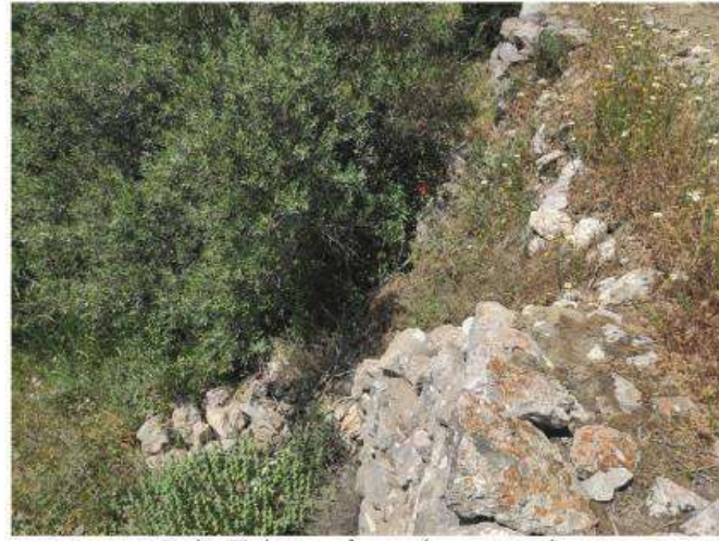
Ο τοίχος T4 νότια του καλντεριμιού, πριν τις εργασίες.