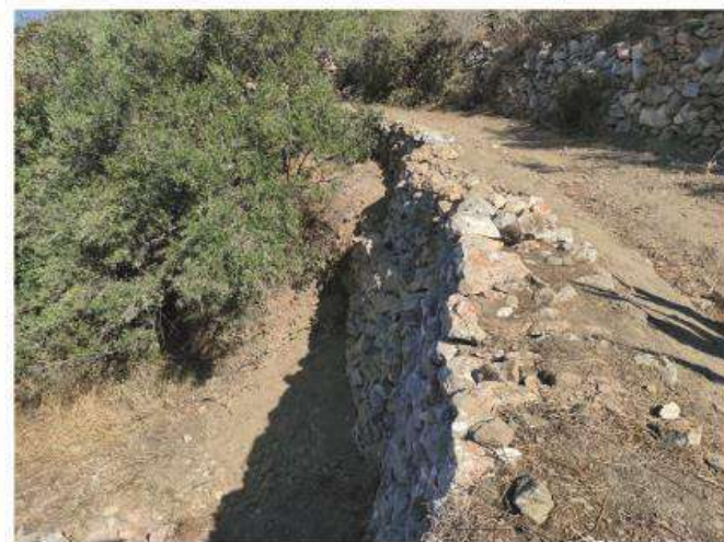
Ο τοίχος T4 μετά τις εργασίες αποκατάστασης και ενίσχυσής του.