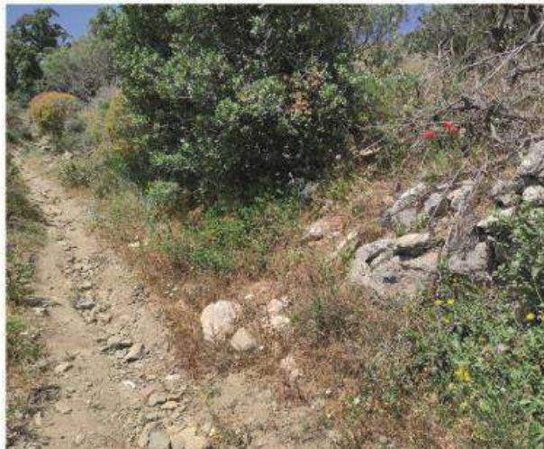
Άποψη προς βορρά πριν τις εργασίες.