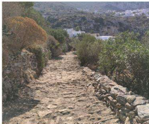
Το μονοπάτι 4 προς Στρούμφο μετά τις εργασίες. Άποψη προς νότο.