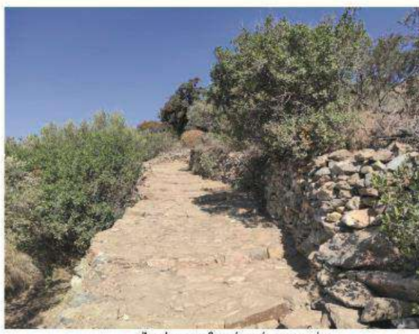
Άποψη προς βορρά μετά τις εργασίες.