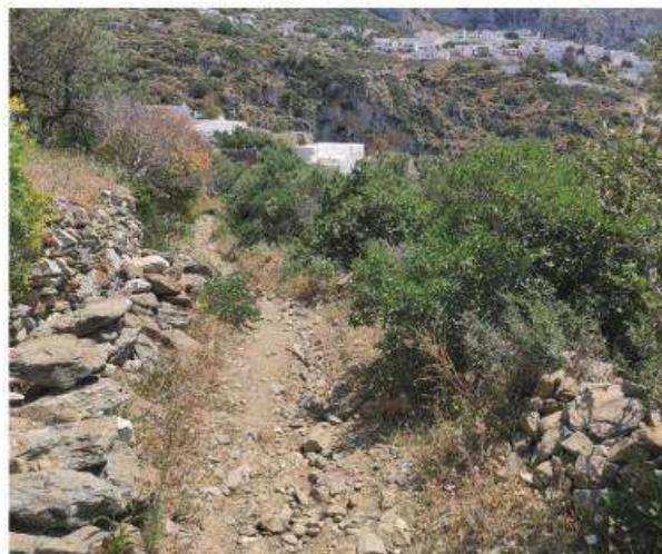
Το μονοπάτι 4 προς Στρούμφο πριν τις εργασίες. Άποψη προς νότο.